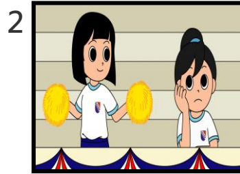
楠楠在看台上觀看比賽