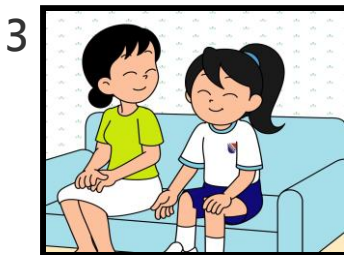
楠楠明白到做事時應投入參