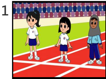
楠楠預備參與比賽